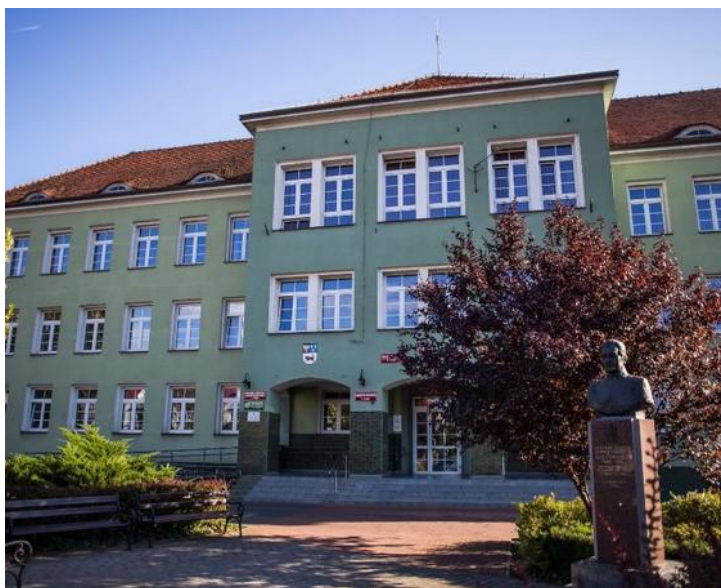
Urząd Miejski w Turku ul. Kaliska 59

W 2024 r. przeprowadzono nabory na wolne stanowiska urzędnicze w komórkach organizacyjnych urzędu: