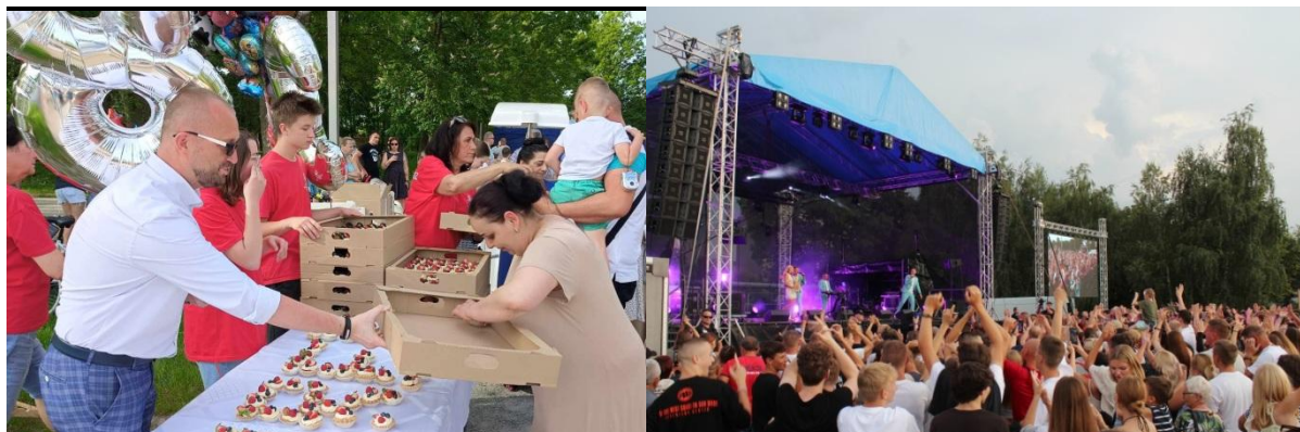
683. urodziny miasta w Parku Miejskim im. Żerminy Składkowskiej i Dni Turku i Gminy Turek

Ponadto na terenie miasta w 2024 roku odbywały się liczne wydarzenia organizowane przez Urząd Miejski w Turku, jednostki organizacyjne i organizacje pozarządowe, m.in. takie jak, festyny, rajdy rowerowe, turnieje sportowe.