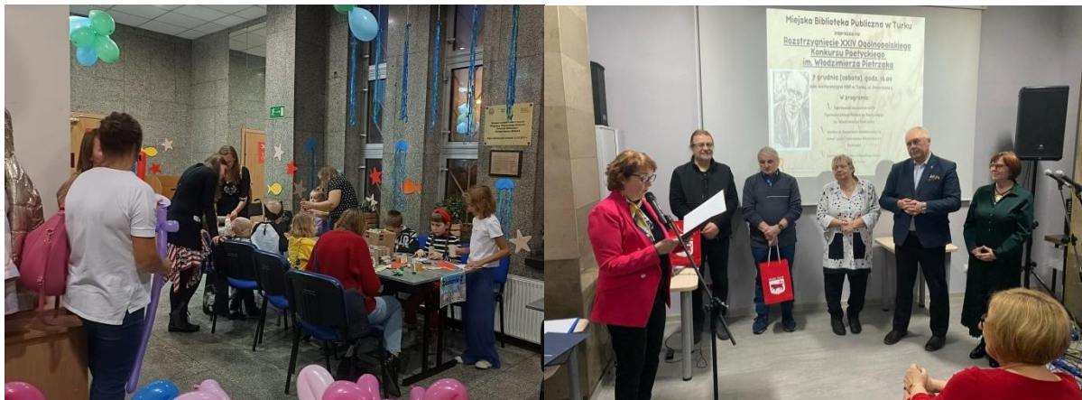
X Noc Bibliotek i XXIV Ogólnopolski Konkurs Poetycki im. Włodzimierza Pietrzaka

Ponadto biblioteka współorganizowała z Urzędem Miejskim w Turku, Muzeum i MDK imprezy plenerowe tj. kino plenerowe, rajdy rowerowe, Urodziny Miasta i Dzień Dziecka.