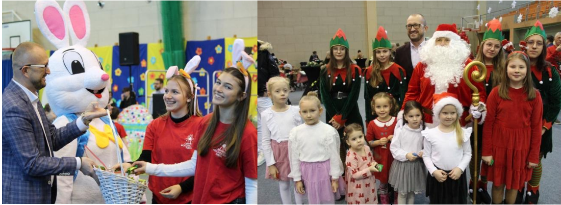
Kraina Zająca Wielkanocnego i Turkowska Magia Świąt Bożego Narodzenia