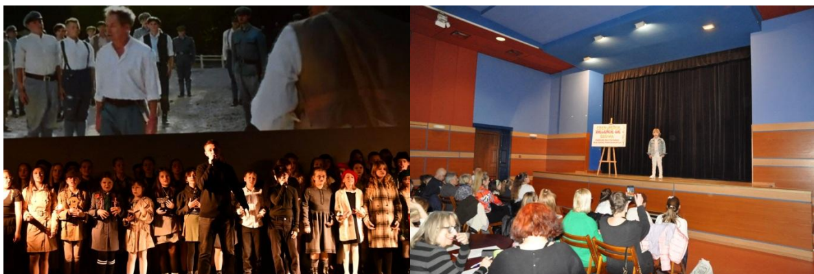
Spektakl muzyczny "Nie pytaj o Polskę" i konkurs recytatorski „Czerwieńcie, zieleńcie się słowa”