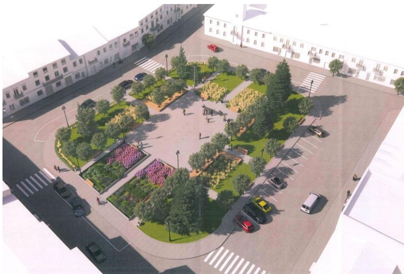
Projekt rewitalizacji Starówki Miejskiej w Turku