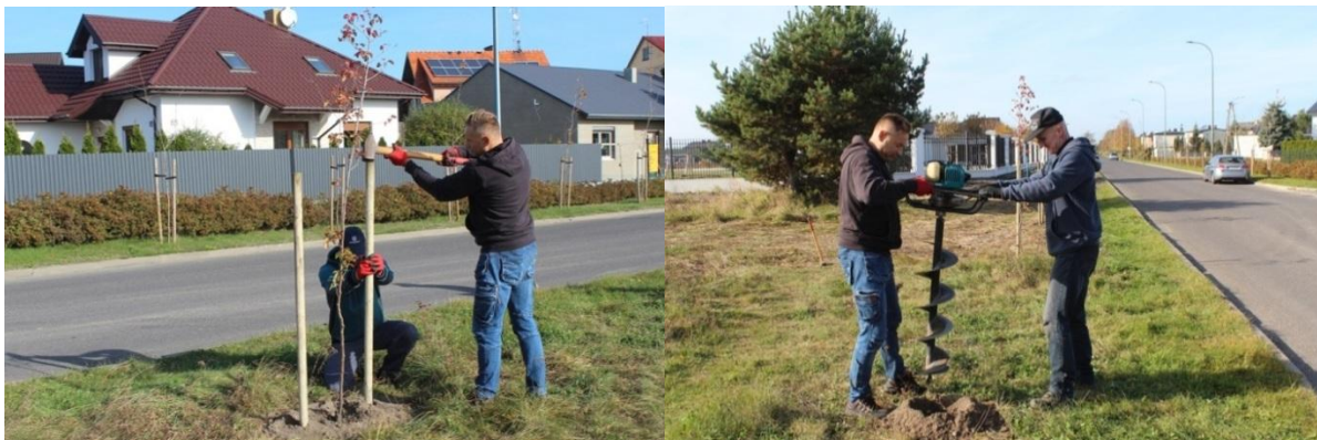
Sadzenie drzew przy ul. Słonecznej

szerokolistna, grusza drobnoowocowa, klon pospolity, czeremcha zwyczajna). Na realizację przedmiotowego zadania przeznaczono środki w kwocie 13 199,87 zł, z czego 1 320,00 zł stanowiły środki własne Gminy Miejskiej Turek, natomiast 11 879,87 zł stanowiło dofinansowanie pozyskane z Urzędu Marszałkowskiego Województwa Wielkopolskiego.