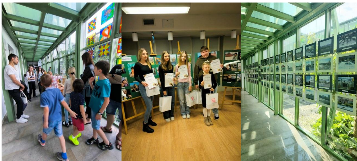
Noc Muzeów, Konkurs „Selfie z moją małą Ojczyzną”, Wystawa „Turek wczoraj i dziś”