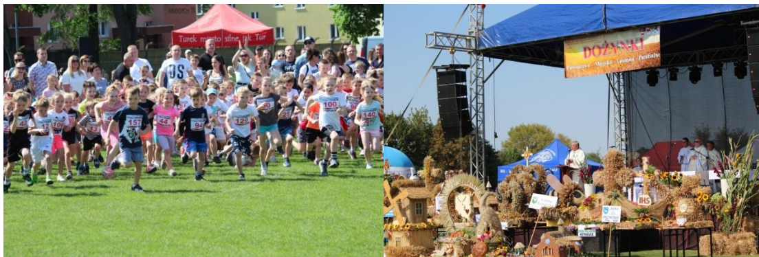
Biegi „Europa Tu-rek” i Powiatowo-Miejsko-Gminno-Parafialne Dożynki