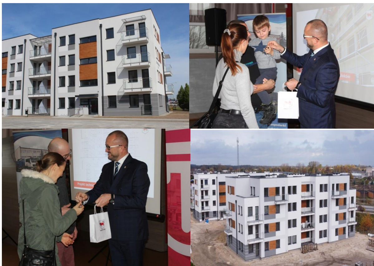
Budowa zespołu dwóch budynków mieszkalnych wielorodzinnych oraz przekazanie kluczy do mieszkań komunalnych